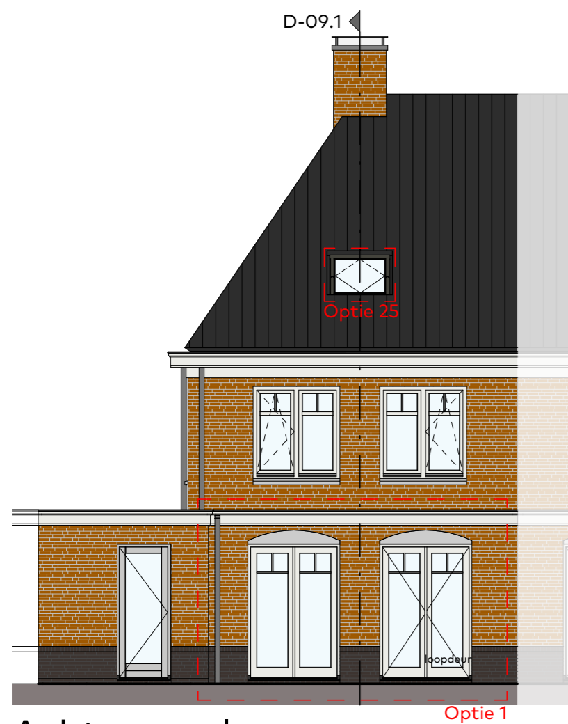
Achtergevel schaal 1:100