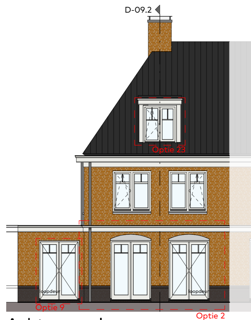
Achtergevel schaal 1:100