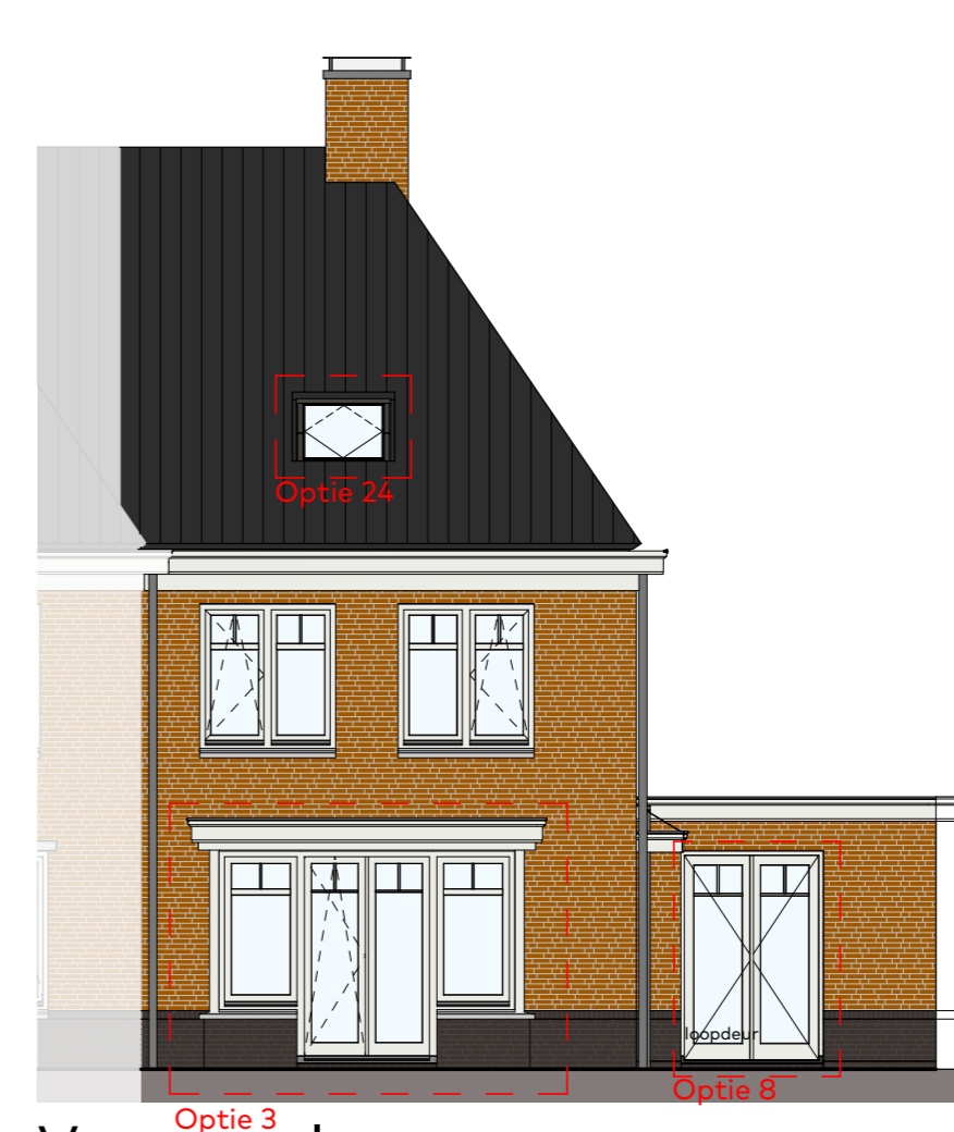
Voorgevel schaal 1:100