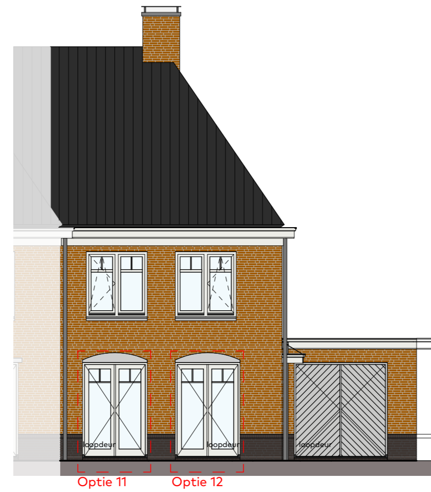
Voorgevel schaal 1:100