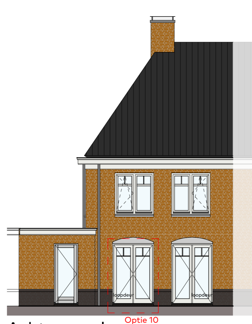
Achtergevel schaal 1:100