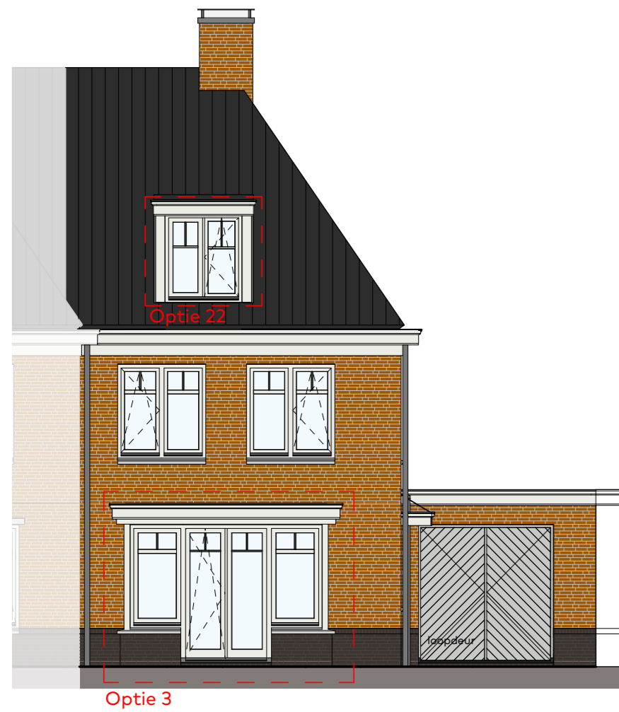
Voorgevel schaal 1:100