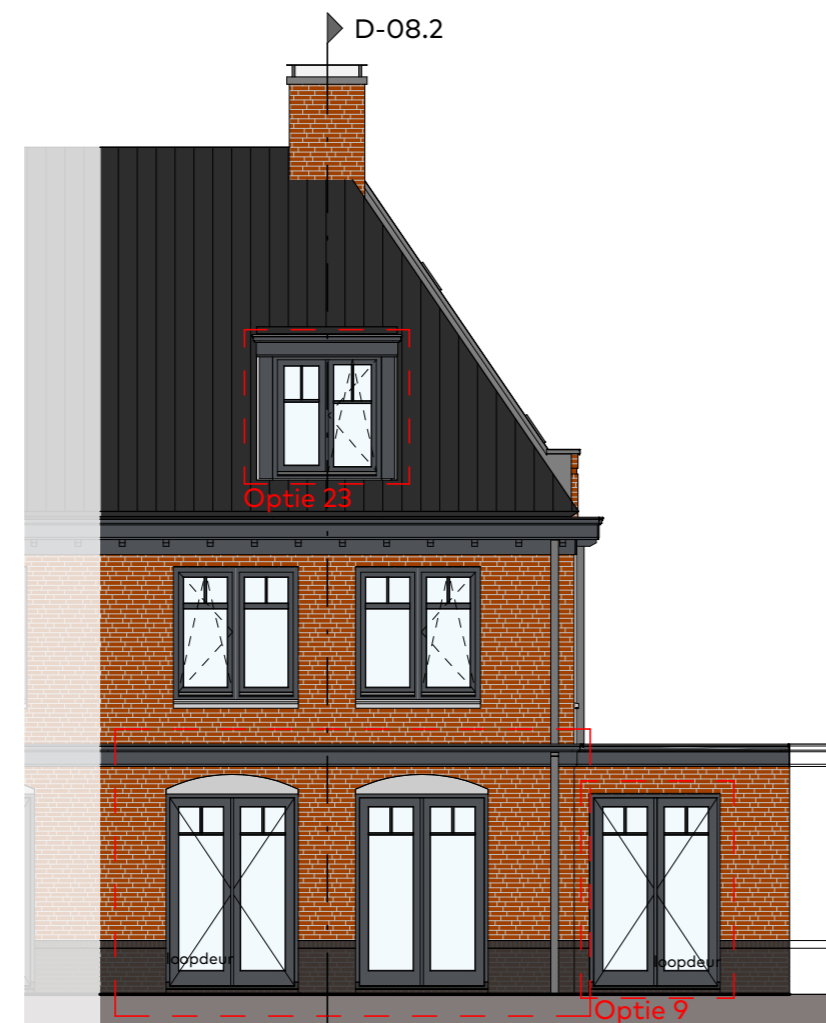
Achtergevel schaal 1:100