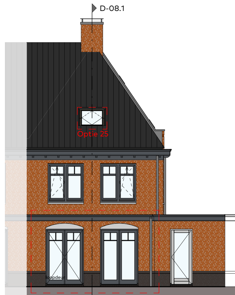
Achtergevel schaal 1:100