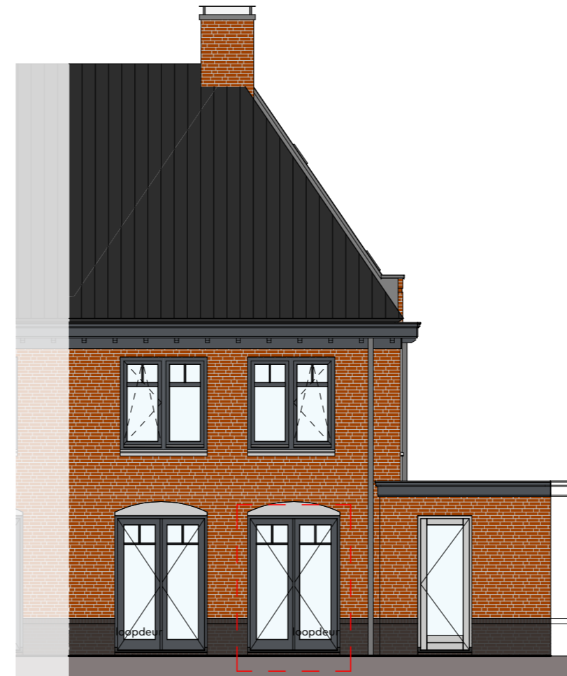
Achtergevel schaal 1:100