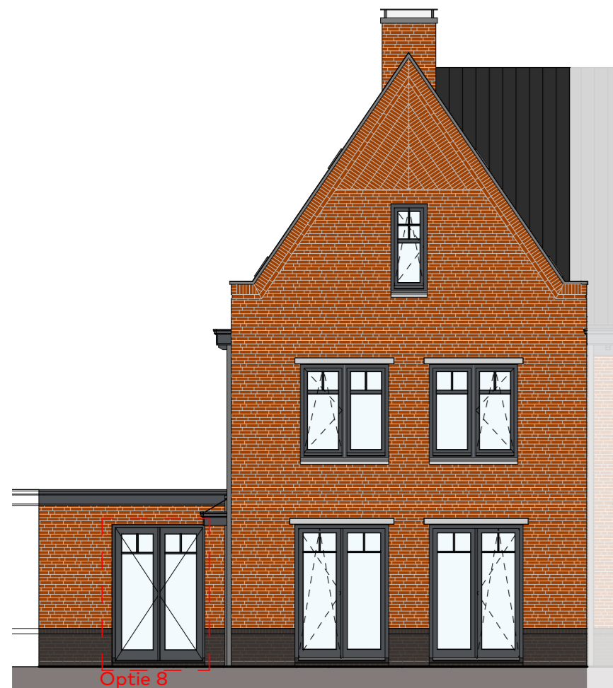
Voorgevel schaal 1:100