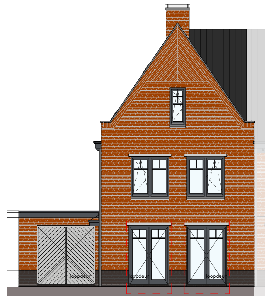
Voorgevel schaal 1:100