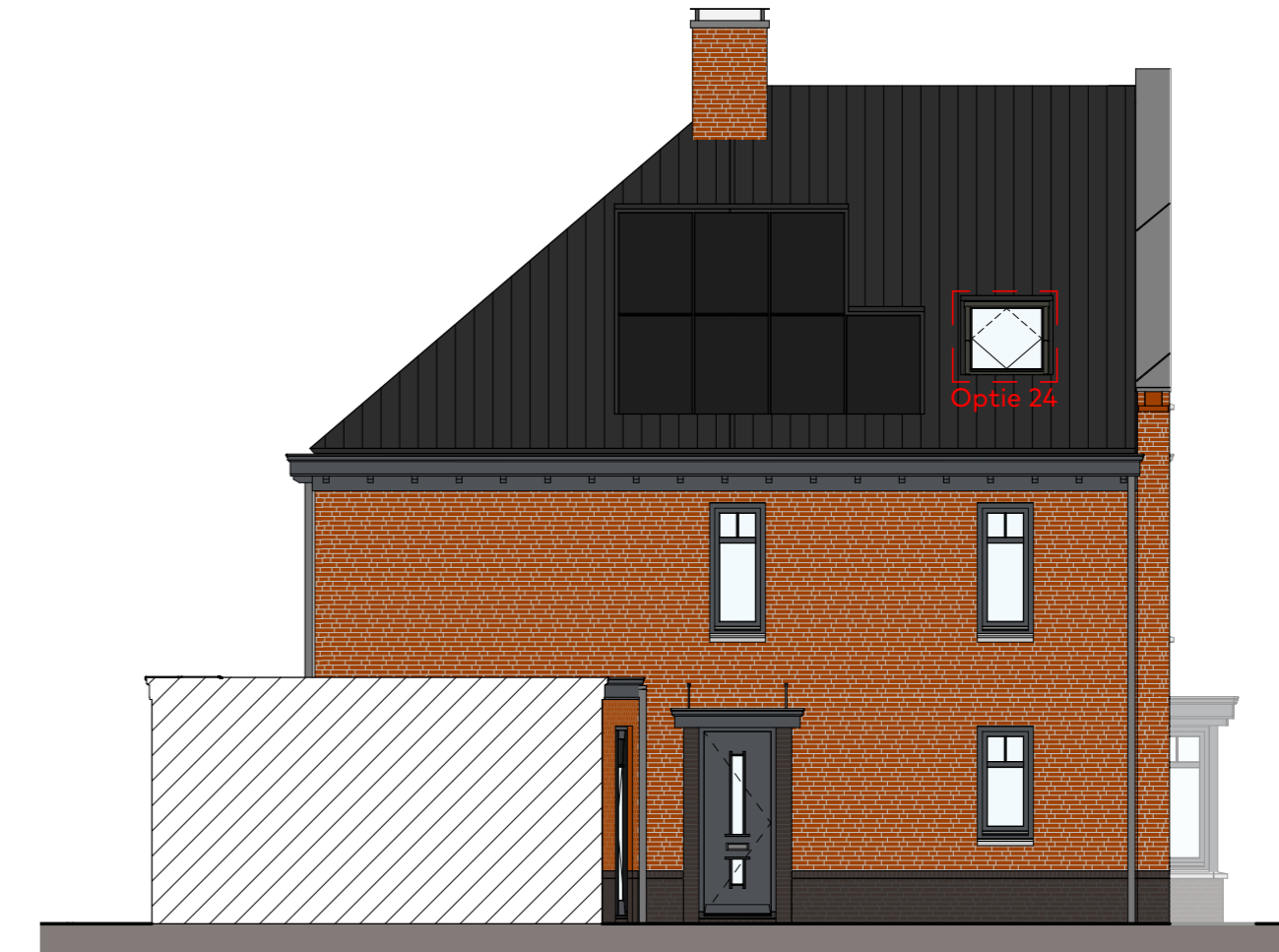
Linkerzijgevel schaal 1:100