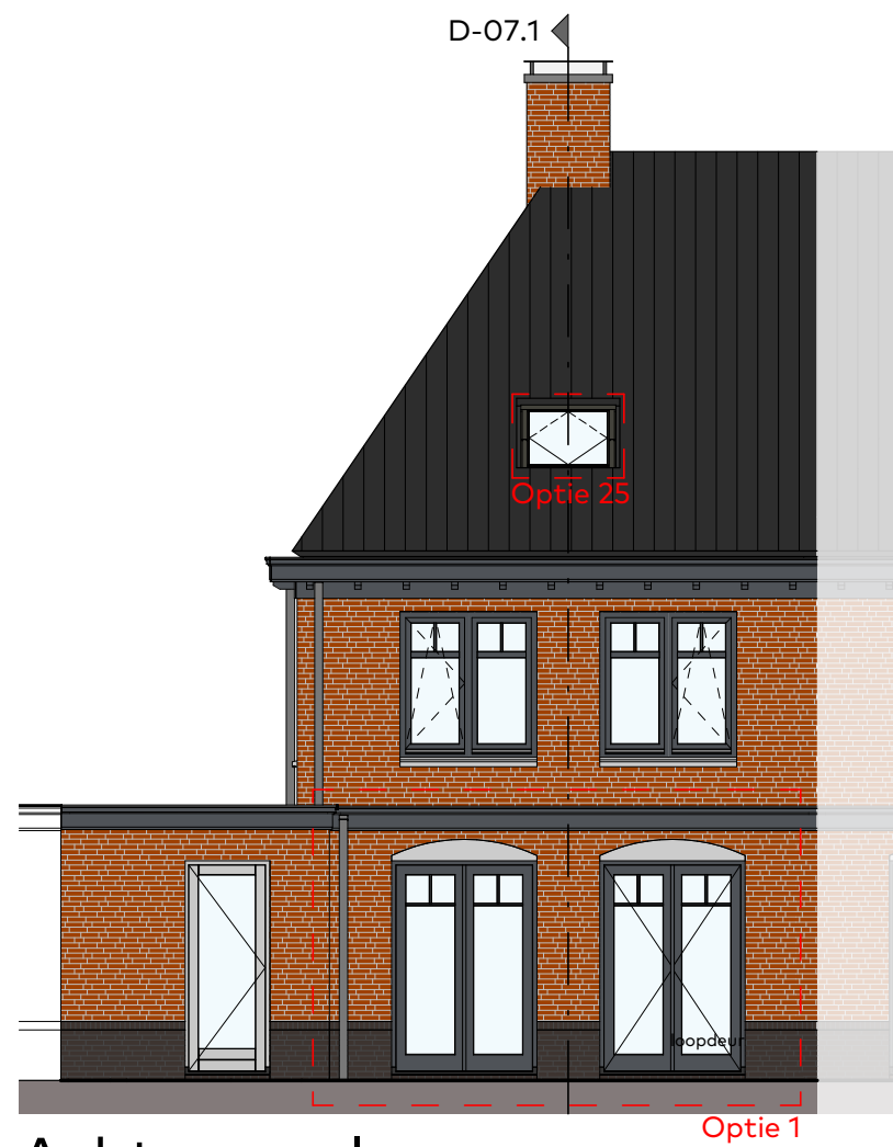
Achtergevel schaal 1:100