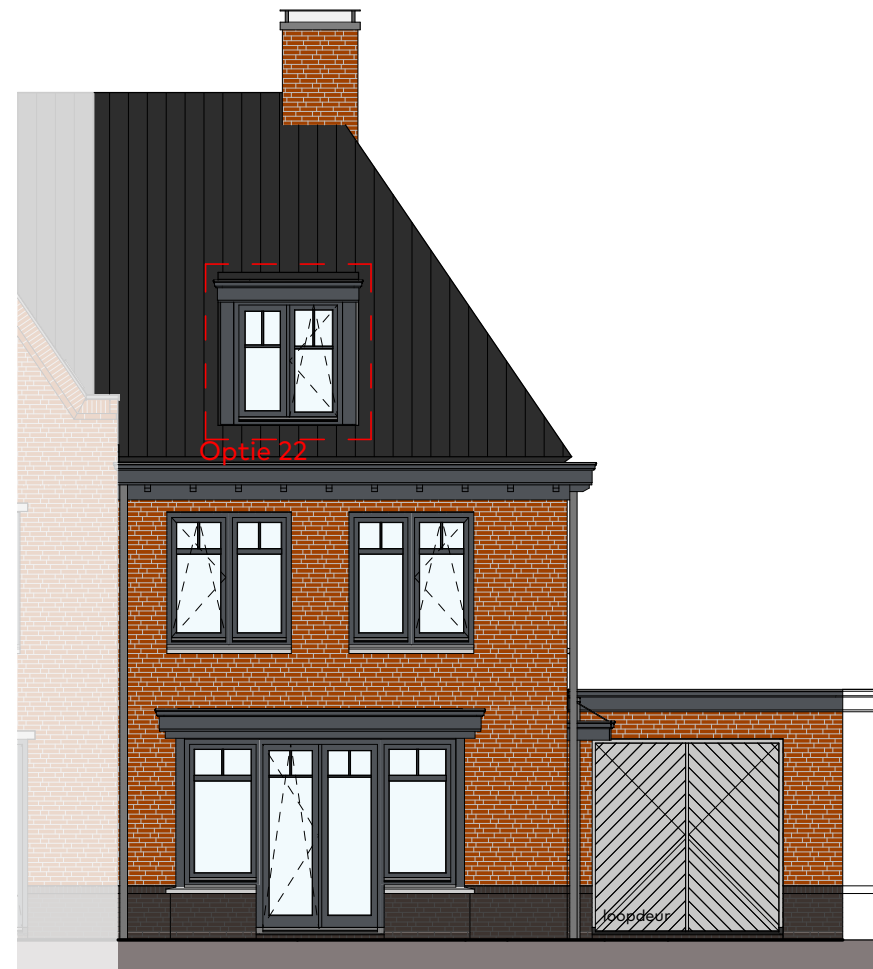
Voorgevel schaal 1:100