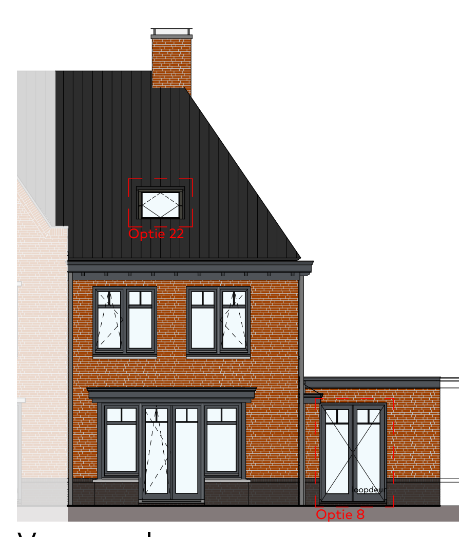
Voorgevel schaal 1:100