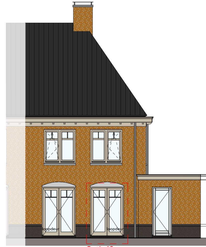
Achtergevel schaal 1:100