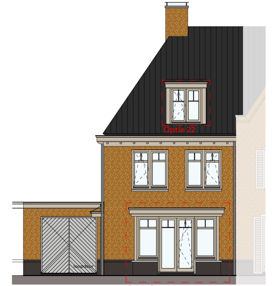
Voorgevel schaal 1:100