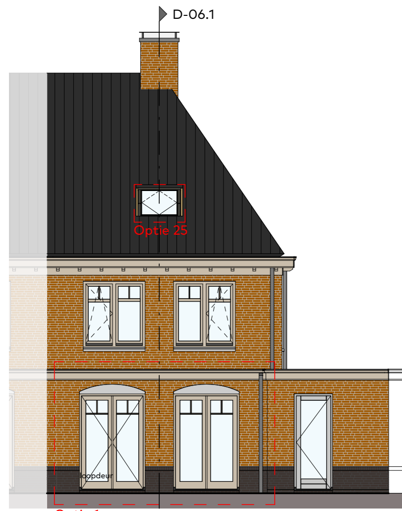
Achtergevel schaal 1:100