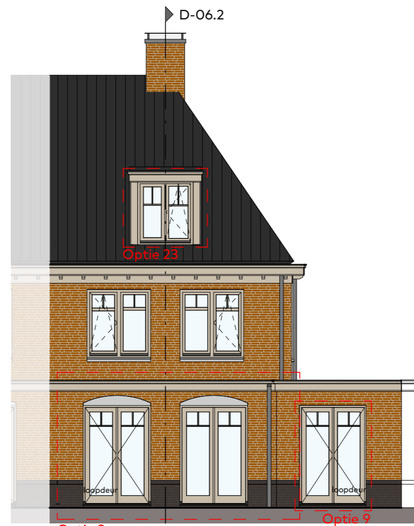
Achtergevel schaal 1:100