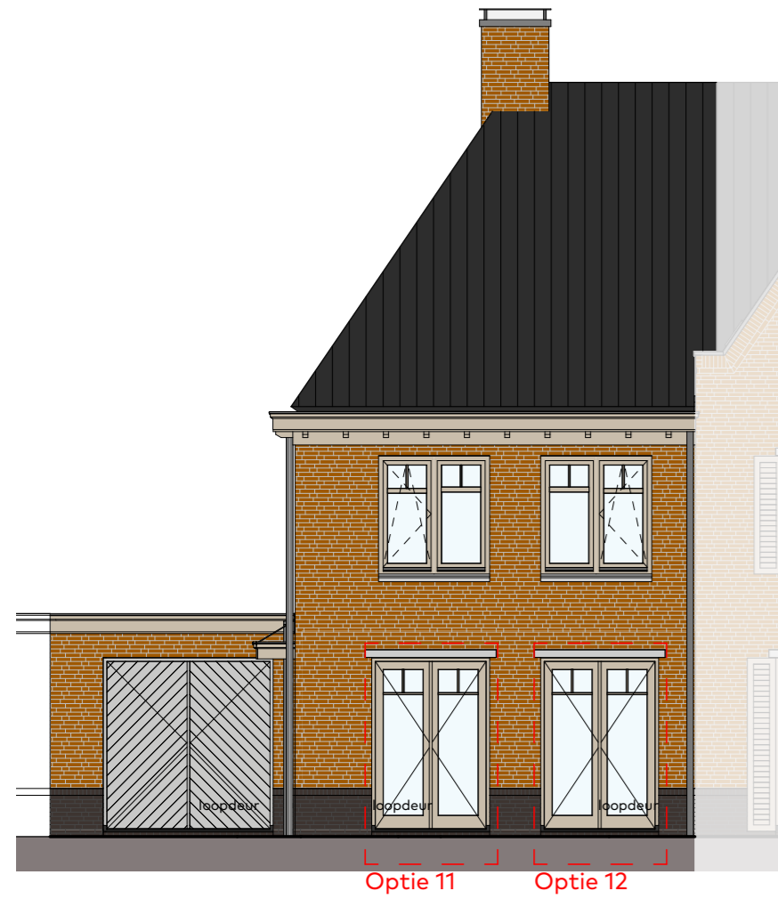
Voorgevel schaal 1:100