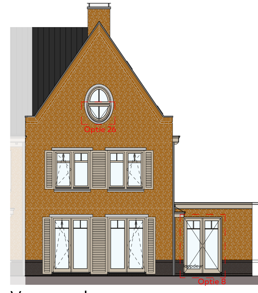
Voorgevel schaal 1:100