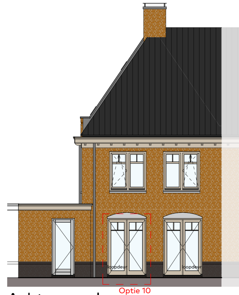
Achtergevel schaal 1:100