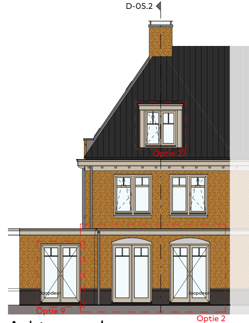
Achtergevel schaal 1:100