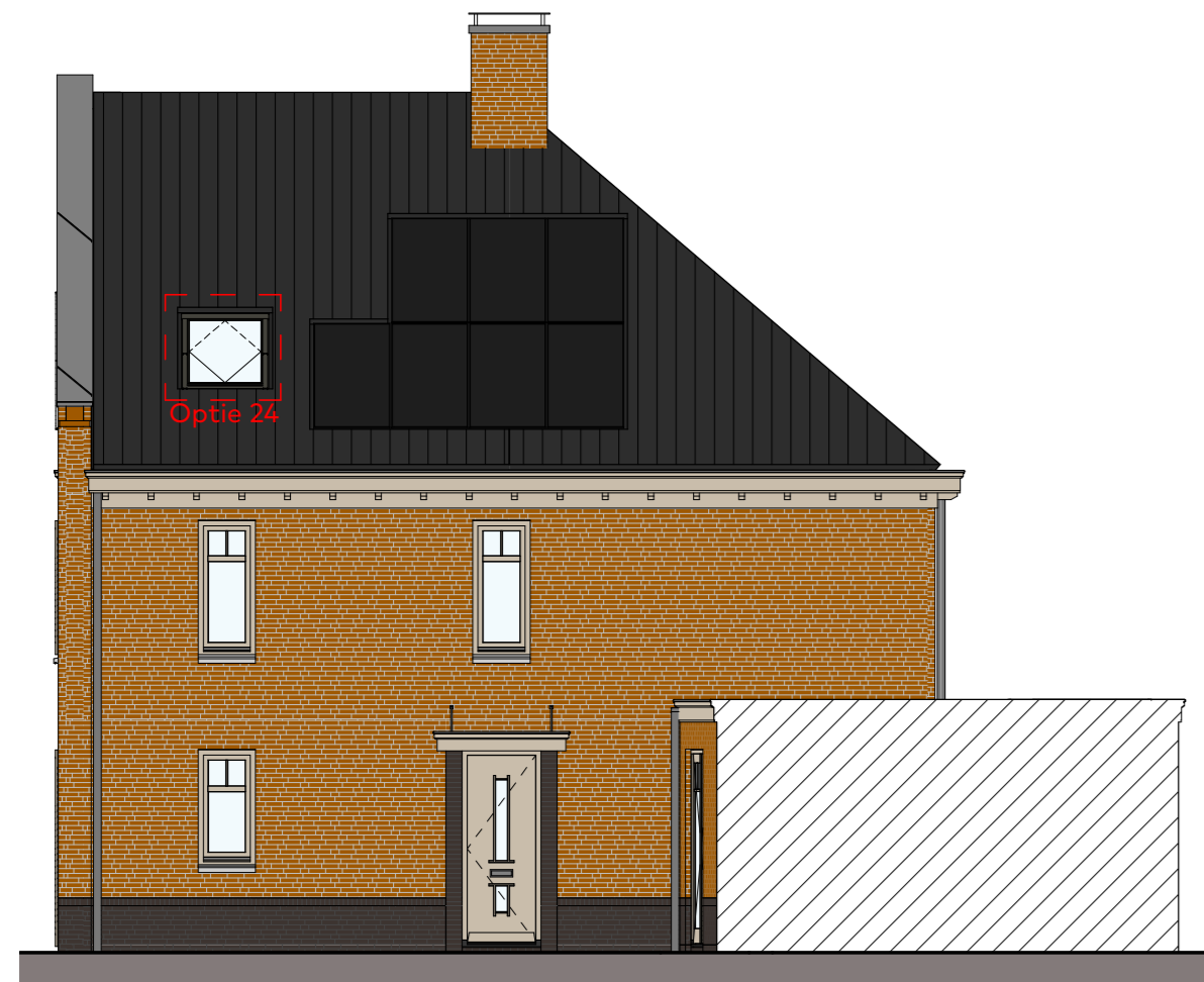
Rechterzijgevel schaal 1:100