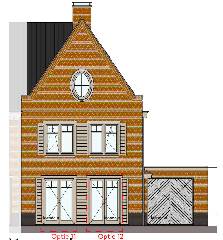
Voorgevel schaal 1:100