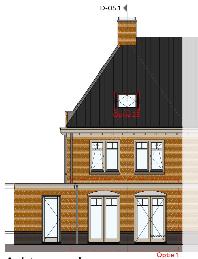
Achtergevel schaal 1:100