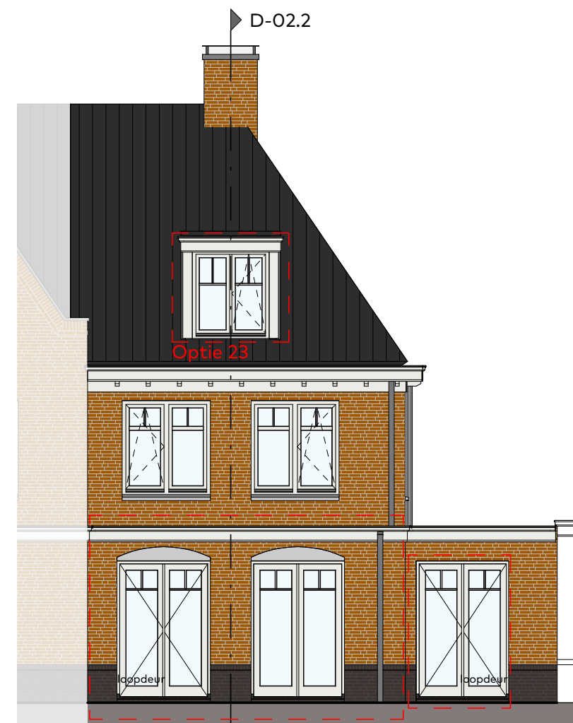
Achtergevel schaal 1:100