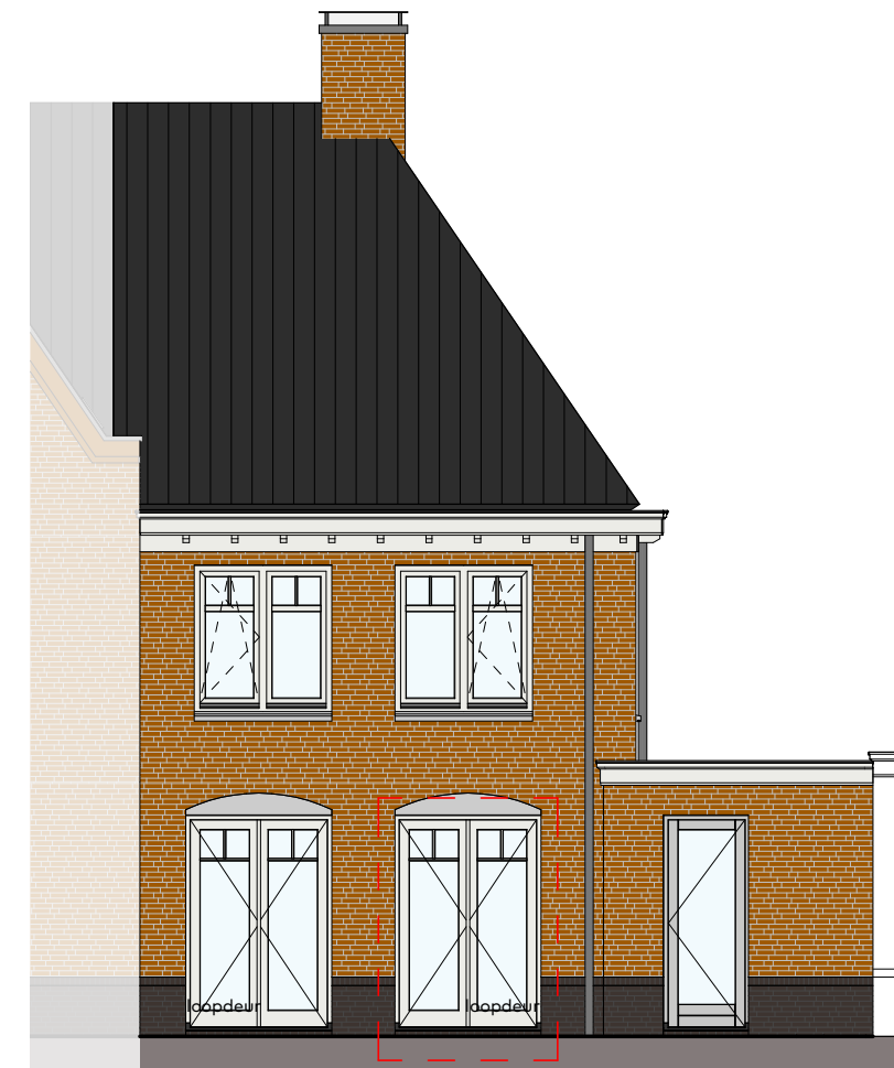
Achtergevel schaal 1:100