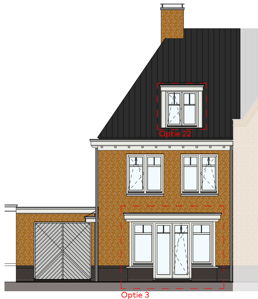
Voorgevel schaal 1:100