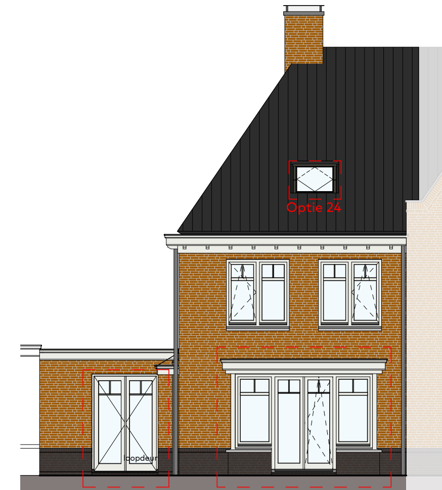
Voorgevel schaal 1:100