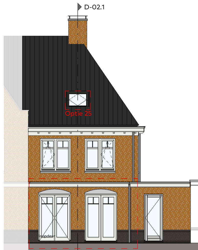
Achtergevel schaal 1:100