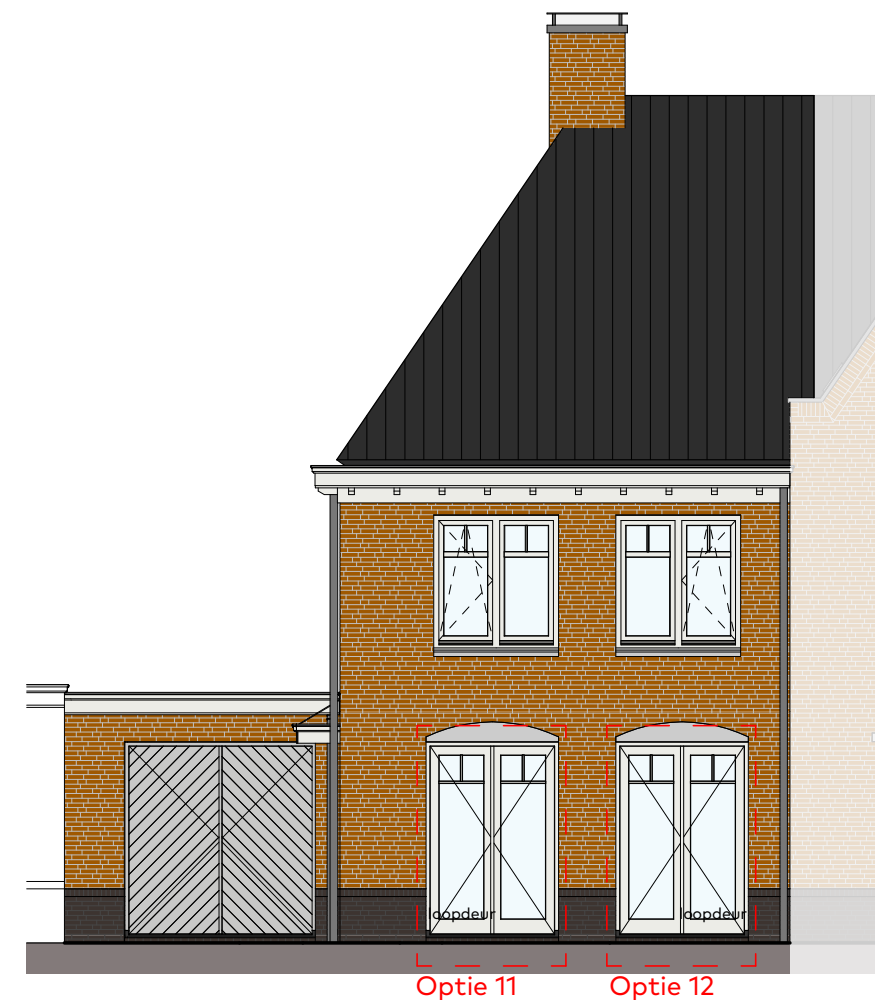
Voorgevel schaal 1:100