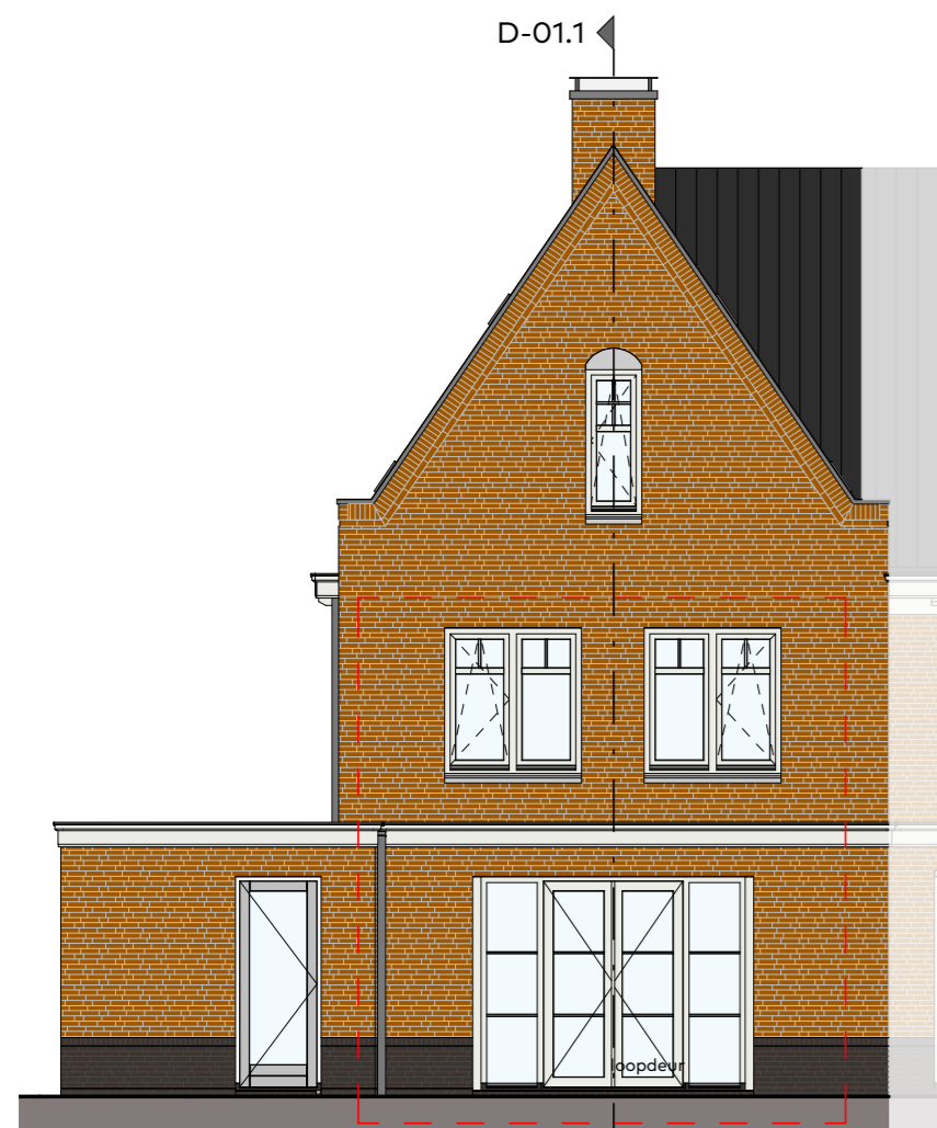
Achtergevel schaal 1 : 100