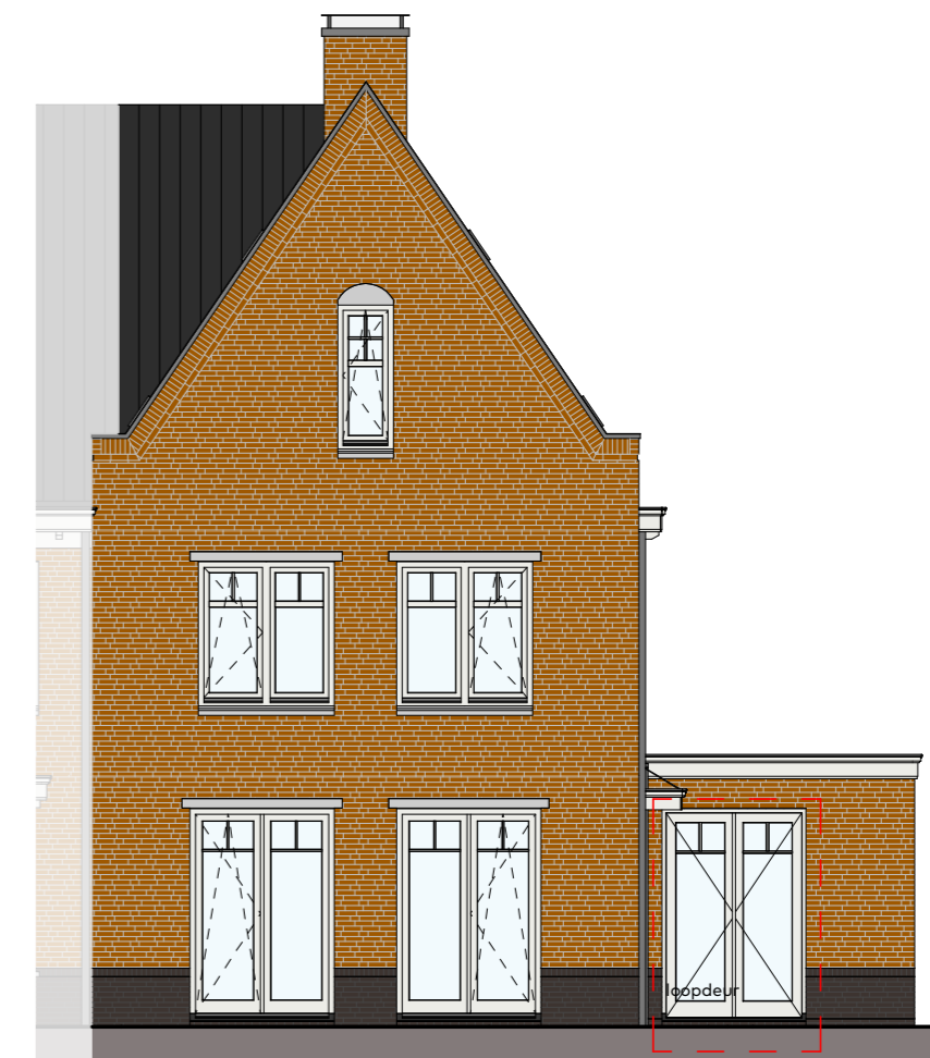
Voorgevel schaal 1 : 100