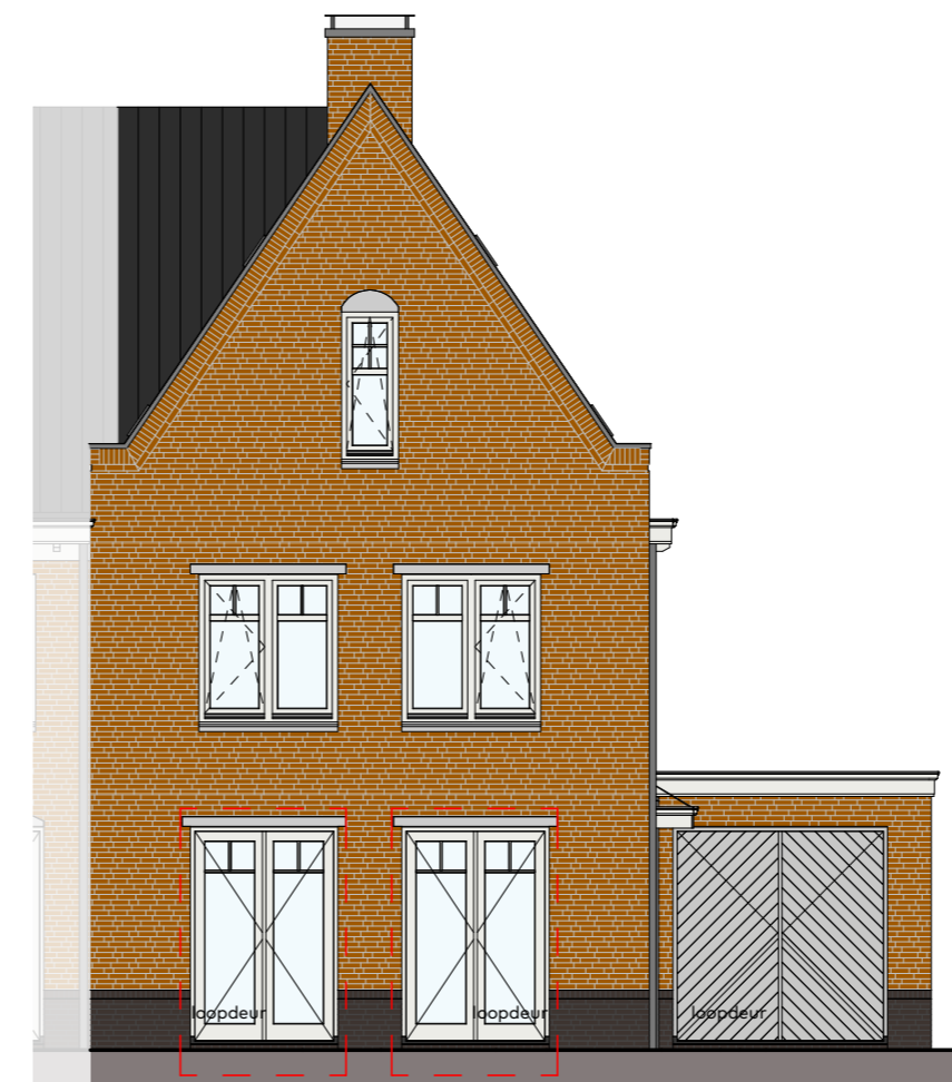
Voorgevel schaal 1 : 100