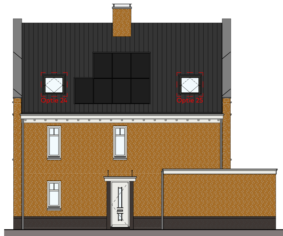
Rechterzijgevel schaal 1 : 100