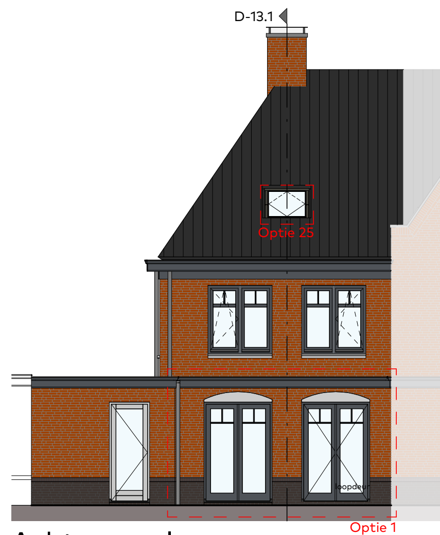
Achtergevel schaal 1:100