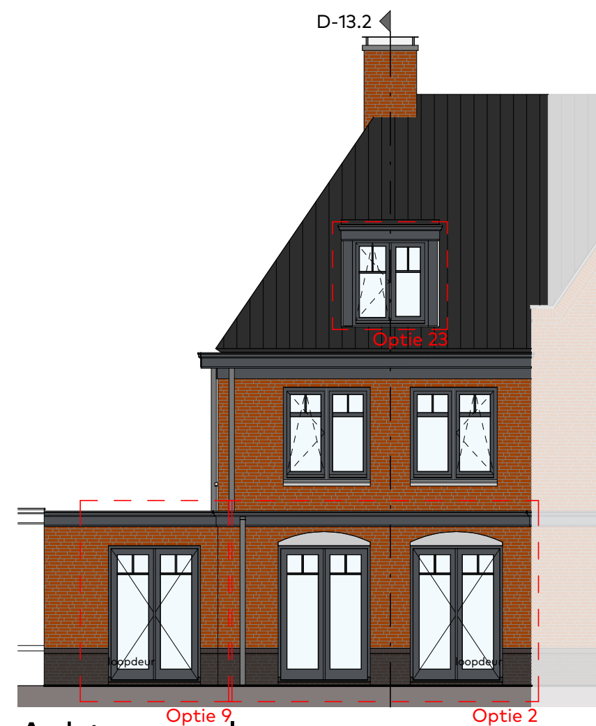
Achtergevel schaal 1:100