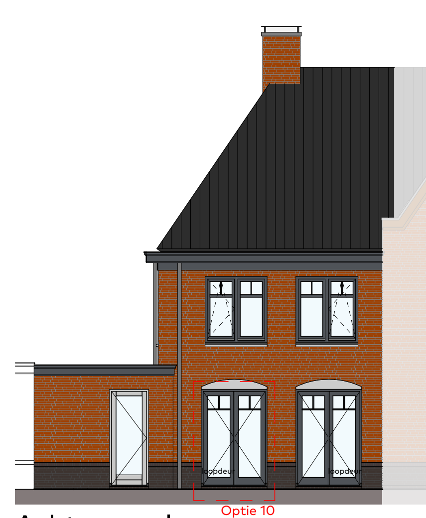
Achtergevel schaal 1:100