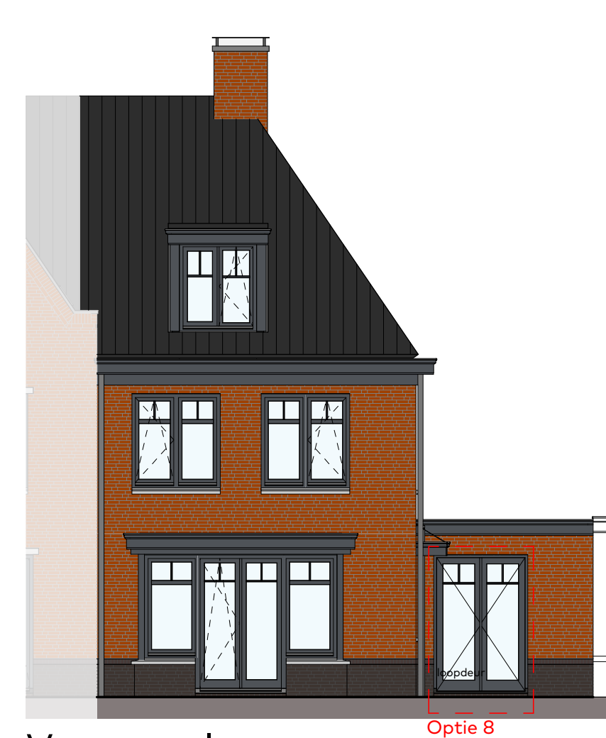
Voorgevel schaal 1:100