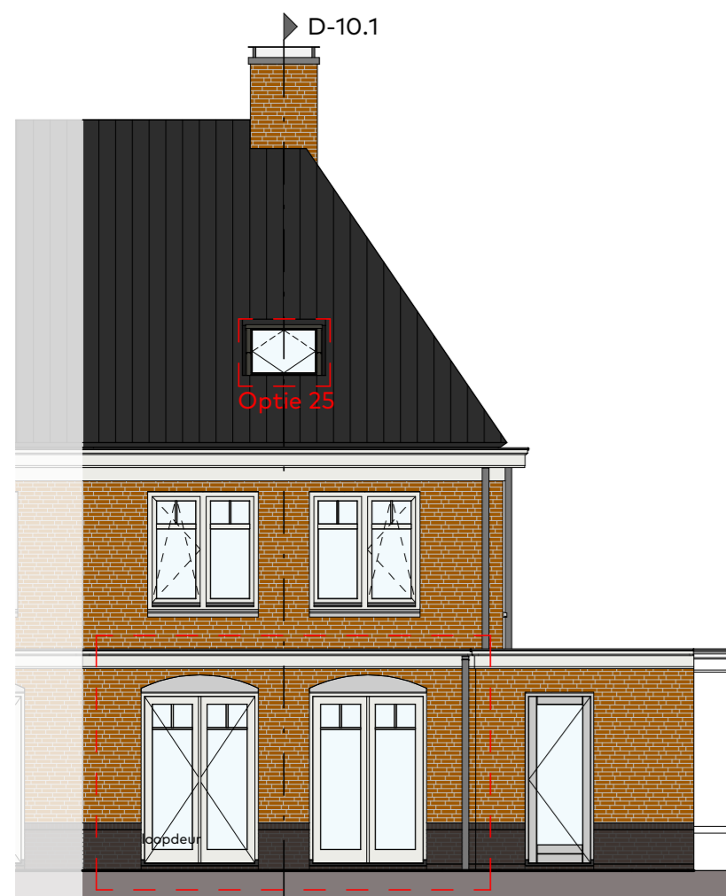
Achtergevel schaal 1 : 100