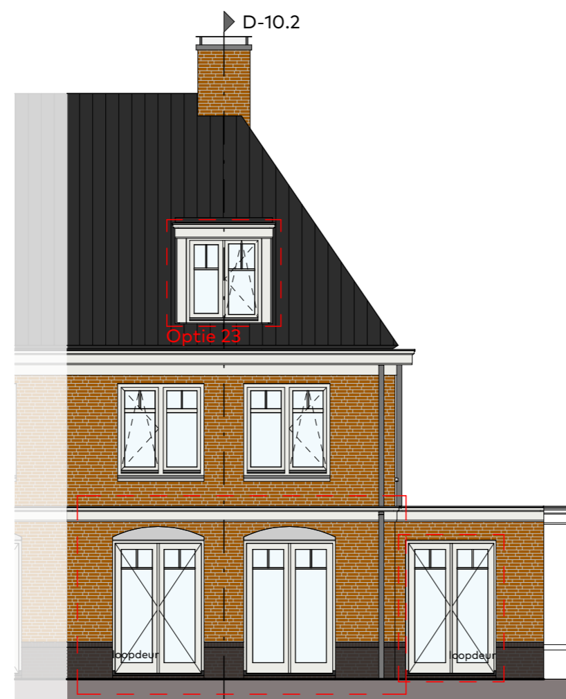
Achtergevel schaal 1 : 100