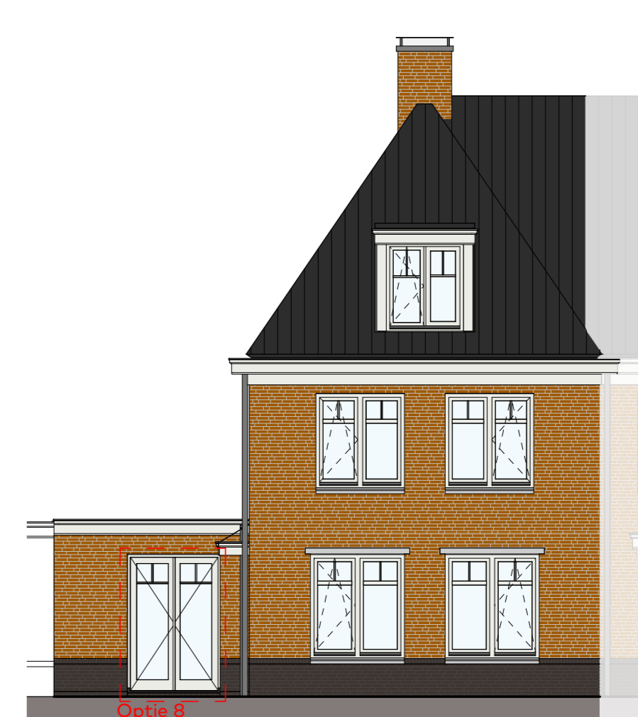
Voorgevel schaal 1 : 100