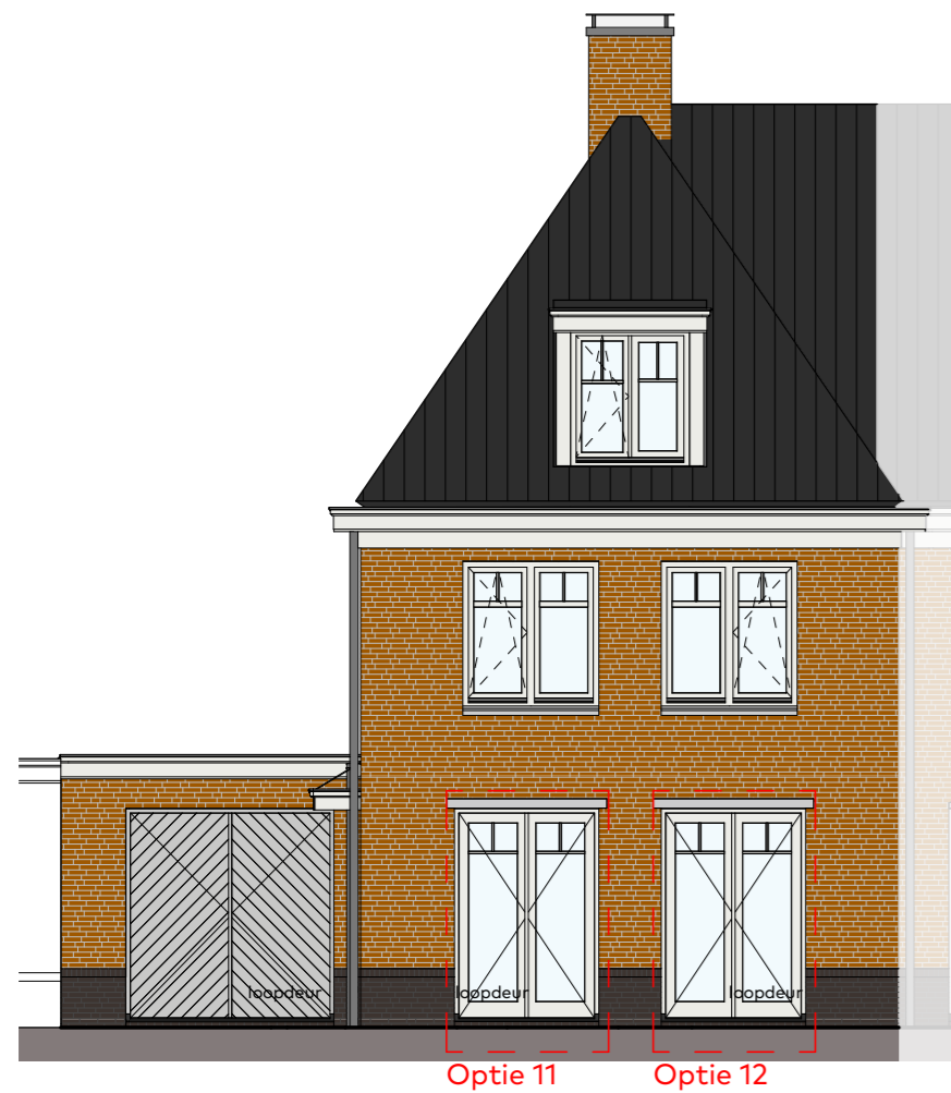
Voorgevel schaal 1 : 100