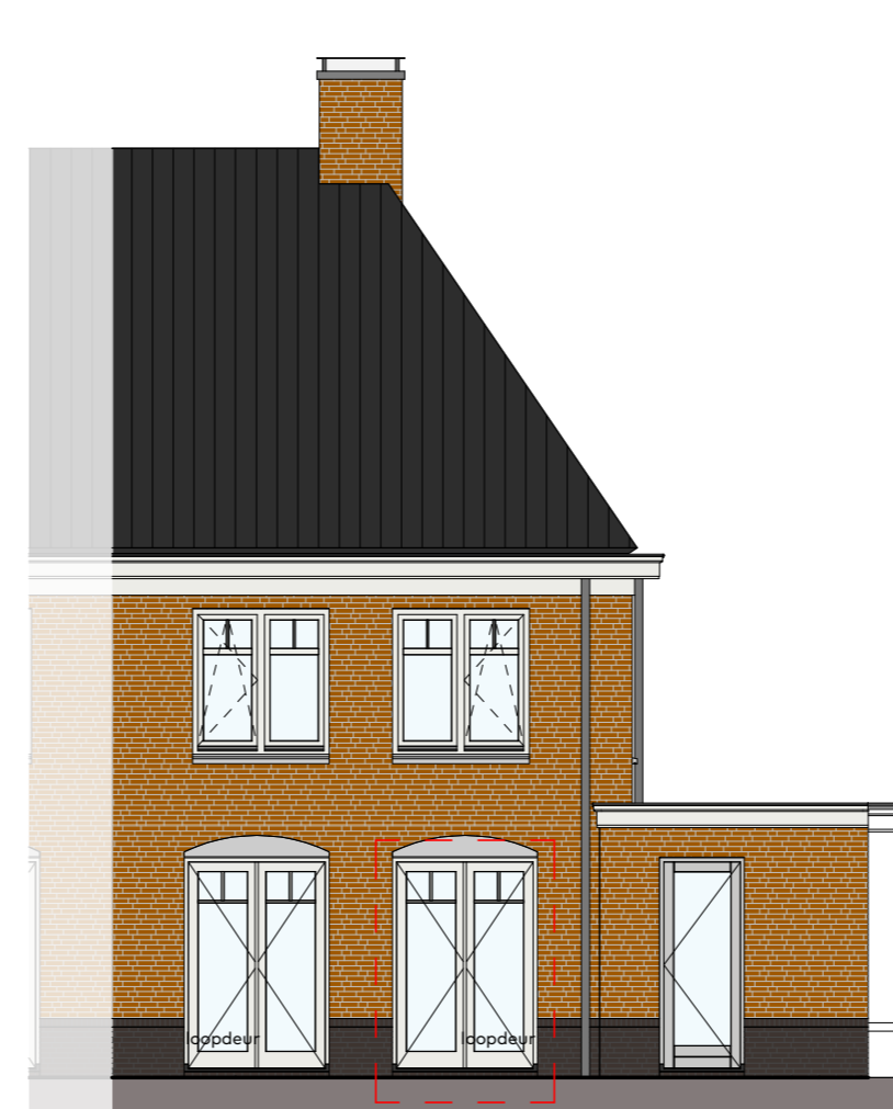
Achtergevel schaal 1 : 100